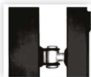
Scharnier 90° opendraaiend