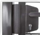
Sluiting d.m.v. een Locinox slot