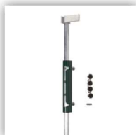
t.b.v. dubbele poort